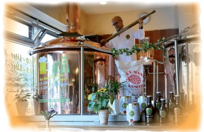
Sudhaus mit Braumeister