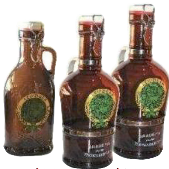
1 Liter 2 Liter